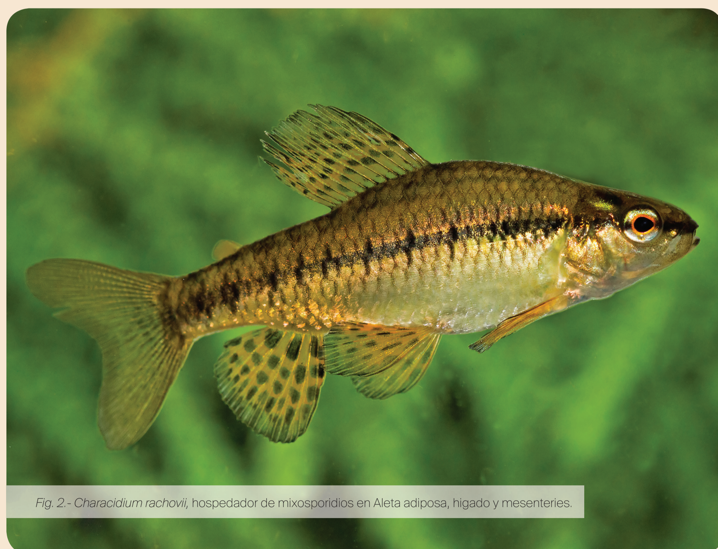
Fig. 2- Characidium rachovii , hospedador de mixosporidios en Aleta adiposa, hígado y mesenterios.

eligió el mejor modelo de sustitución con el BIC mediante el programa PartitionFinder (GTR+I+G). Se calculó la distancia génica ( p -distance) en el programa MEGA y la reconstrucción filogenética se realizó usando Inferencia Bayesiana mediante el programa Mr.Bayes.