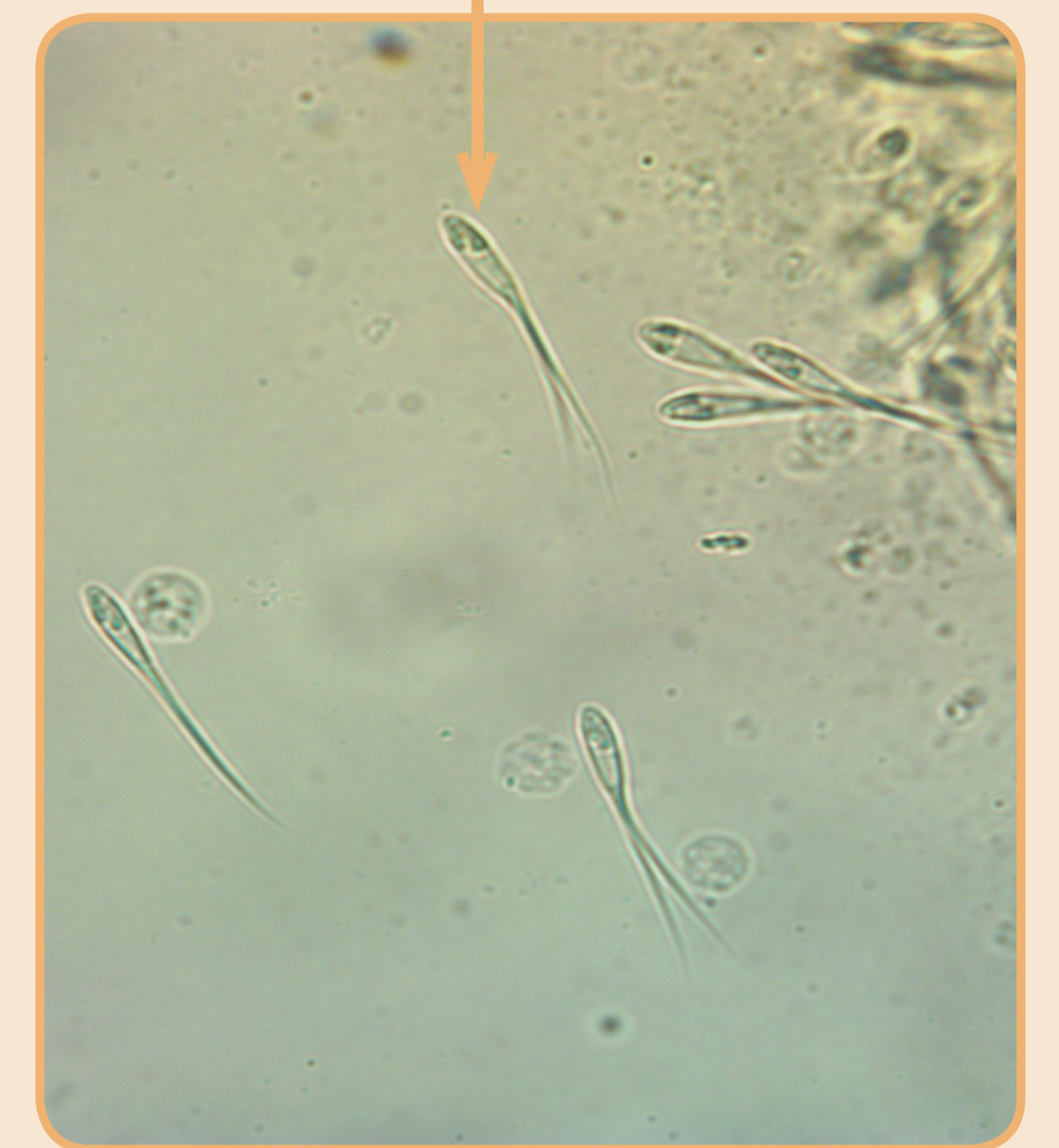
Fig. 1- Aleta adiposa de C. rachovii y mixosporidios de Hígado/mesenterios