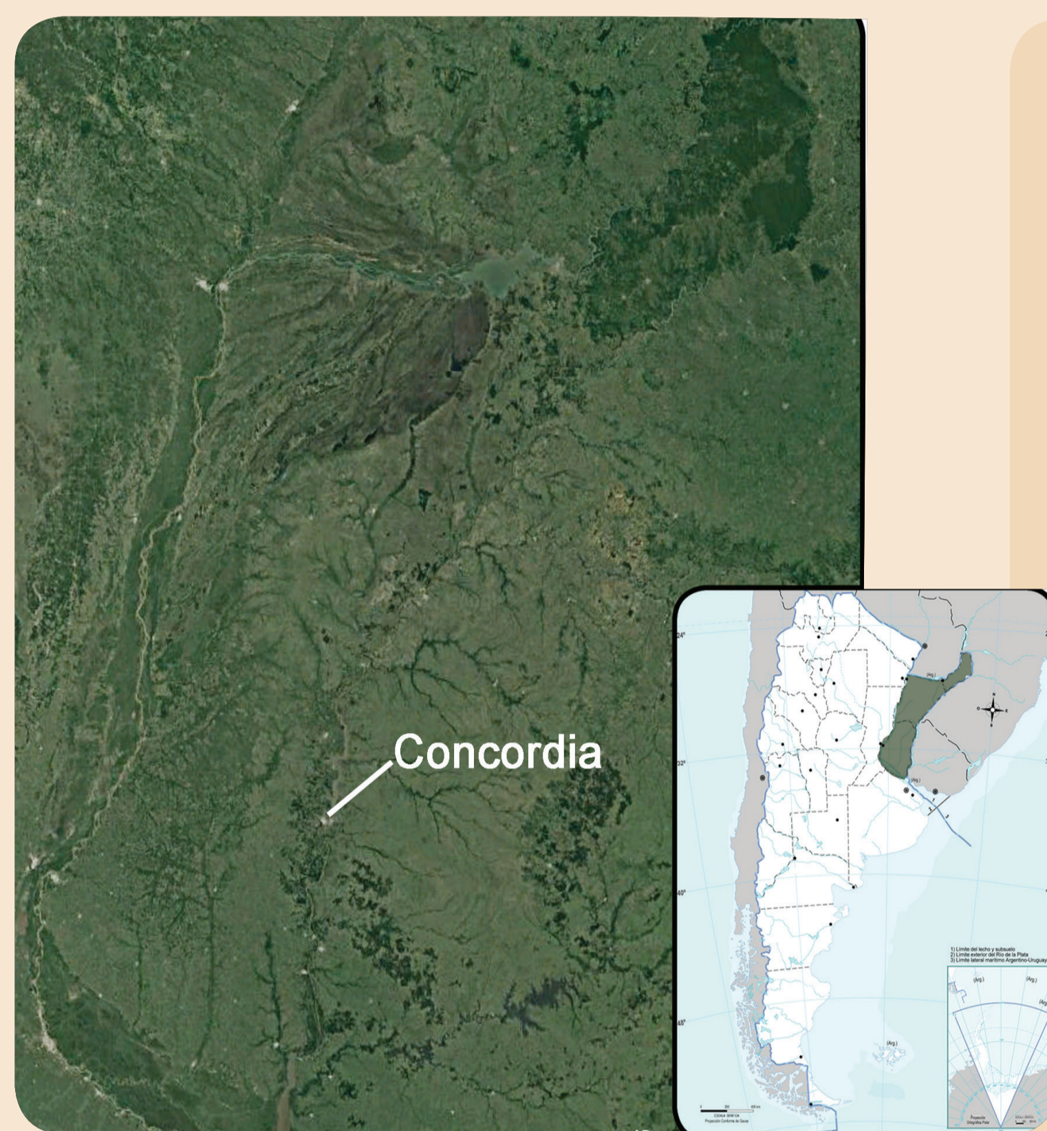
Fig.3- Sitio de colecta de Characidium rachovii